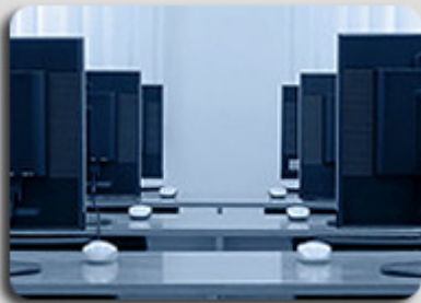
INBSYS & les GDS

INBSYS héberge votre offre produits d'assurance voyage sur son serveur et vous en permet la distribution partout dans le monde