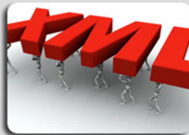
INBSYS Web Service XBE(XML Booking Engine)